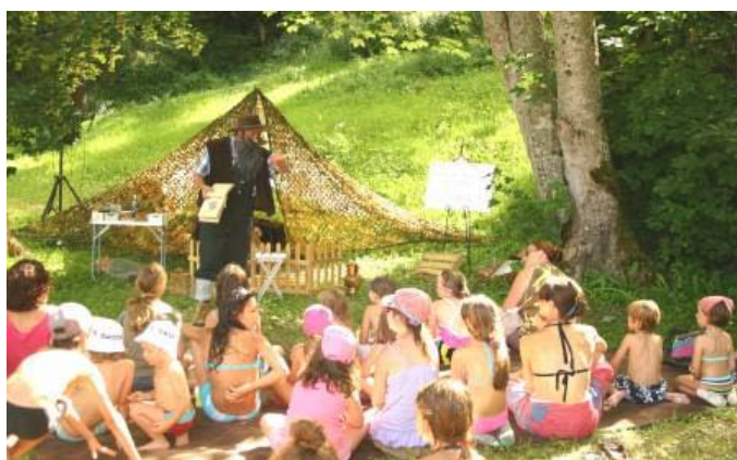
En extérieur en version spectacle...

D'une durée de 45mn, ce spectacle peut se jouer en intérieur comme en extérieur, même en pleine nature et sans électricité (nous fournirons un groupe électrogène). Le Lutinologue et sa marionnette peuvent accompagner une animation ou participer à votre thème.