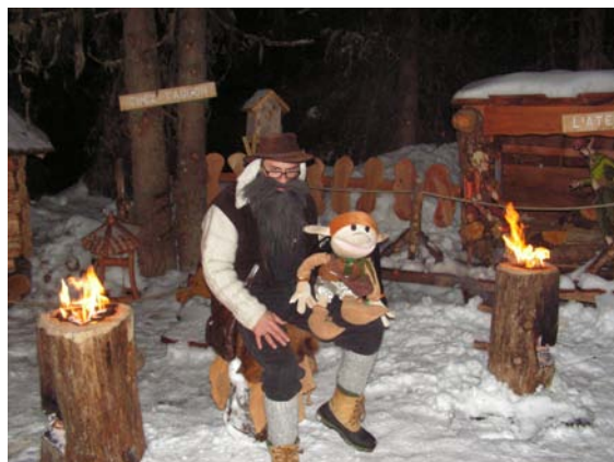
...ou en version conteur uniquement avec Maghi